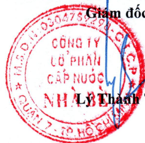
Lý Thành Tài