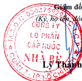
Lý Thành Tài