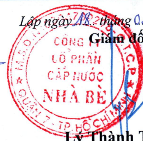
Lý Thành Tài